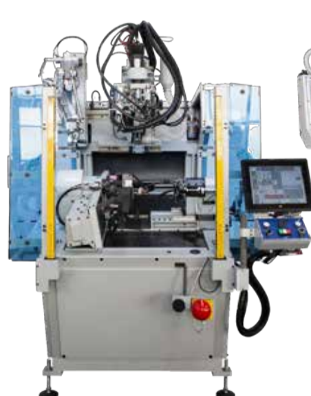
AVANTIUM K175 MÁQUINA DE CARDAR LATERAL DO SAPATO