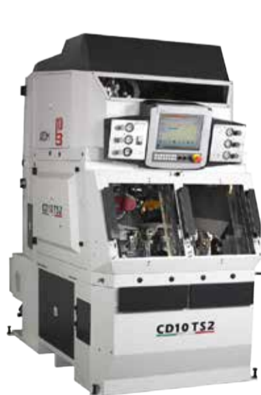
AVANTIUM CD10 TS2 MÁQUINA DE REBATER/ CARDAR FUNDO DO SAPATO