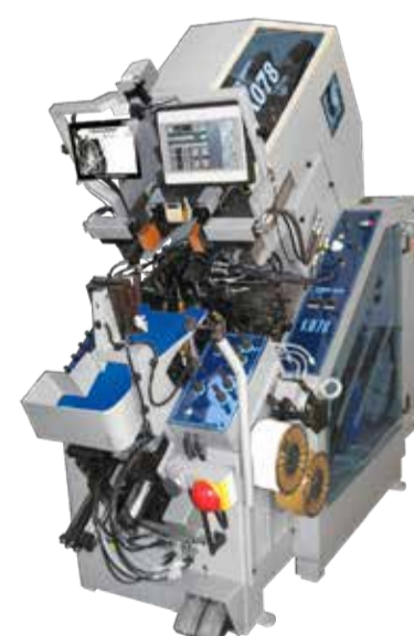
AVANTIUM K078 MÁQUINA DE MONTAR E CENTRAR BICOS