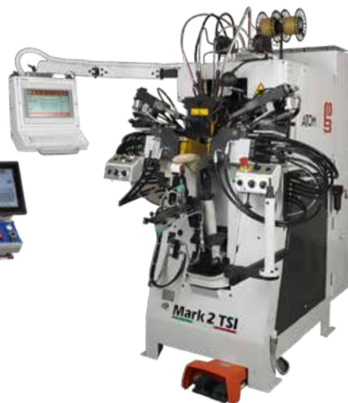
AVANTIUM MARK 2 TSI MÁQUINA DE MONTAR LADOS E CALCANHEIRAS